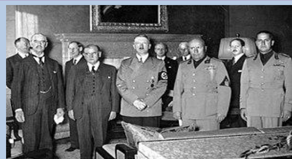
Układ monachijski, od lewej: Chamberlain, Daladier, Hitler, Mussolini,

Porozumienie zawarte na konferencji w Monachium w dniach 29–30 września 1938 dotyczące przyłączenia części terytoriów Czechosłowacji do Rzeszy Niemieckiej. Decyzje dotyczące Czechosłowacji bez udziału jej przedstawiciela.